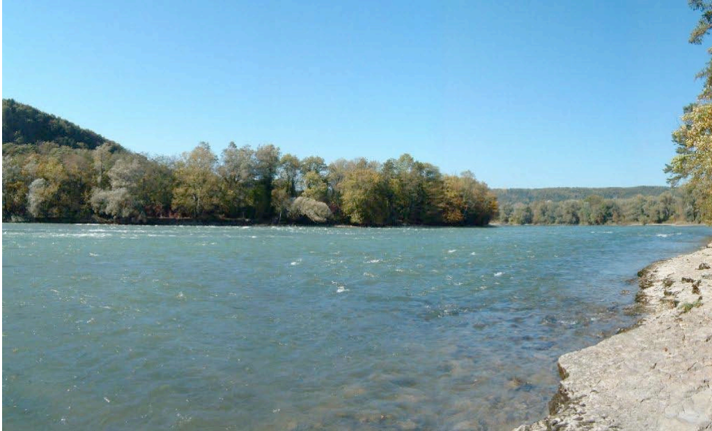
Photo : partie du Rhin en amont de Waldshut-Tiengen (15 Octobre 2003 ; débit env. 370 m 3 /s)

En général et d'après l'ensemble de nos études, nous pouvons affirmer que le débit optimal de base pour la faune aquatique dans le vieux Rhin est de 100m 3 /s environ. Un débit d'environ 80m 3 /s peut être, en intégrant les aspects terrien et semi aquatique, considéré comme un optimum sur la plan écologique dans l'ensemble. Un débit inférieure à 60 m 3 /s est trop faible et indéfendable sur le plan écologique en ce qui concerne la faune aquatique.